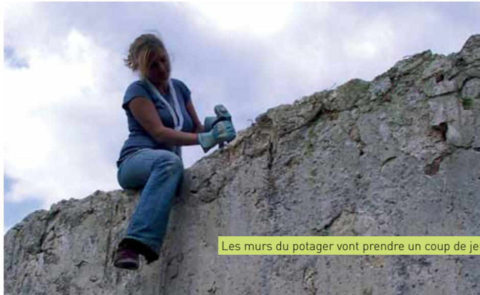
Les murs du potager vont prendre un coup de jeune

Cette action est conjointement menée avec l'association Vir'Volt et les soutiens de la Direction départementale de la cohésion sociale et de la délégation ministérielle à la Ville. Si vous avez entre 14 et 17 ans et que