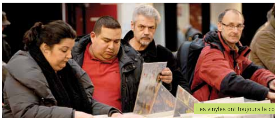
Les vinyles ont toujours la cote

ciens... ont des heures durant fouillé les cartons, les étagères et les étals avec le secret espoir de trouver leur graal. Une quête sans fin qui se poursuivra l'année prochaine avec la 10 ème édition de ce salon