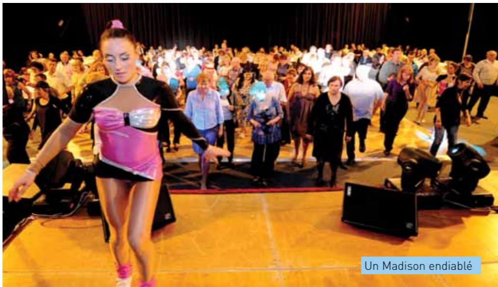
Un Madison endiablé

Une vague de souvenirs a déferlé sur la commune le 27 avril. La Mairie proposait aux Émerainvillois de participer à une « soirée 60's ». Il n'en fallait pas plus pour que des centaines d'habitants réservent leurs places pour cette manifestation. Les enfants du baby-boom ont désormais les cheveux grisonnants mais le cœur toujours aussi jeune. L'Espace Saint-Exupéry n'a eu aucun mal à remplir la salle Guy Drut. Toutes ces personnes et attendaient avec impatience de fouler la piste