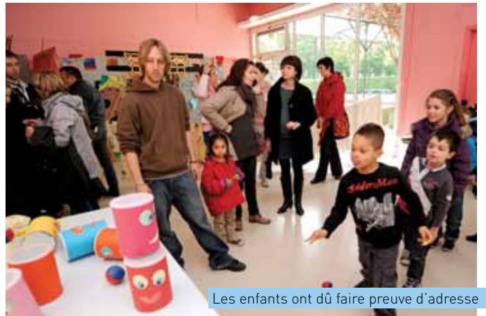
Les enfants ont dû faire preuve d'adresse

Le samedi 25 mai, durant toute la journée, enfants et parents ont défilé dans les locaux de l'école du Bois d'Emery. Celle-ci a été transformée pour l'occasion en véritable parc d'attractions. De la