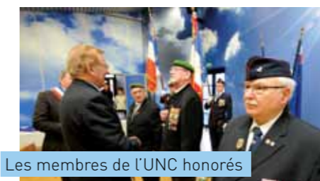
Les membres de l'UNC honorés