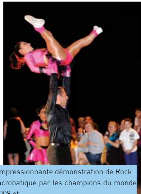
Impressionnante démonstration de Rock acrobatique par les champions du monde 2008 et...

Avec leurs chansons, leurs danses, leurs modes, les années 60 demeurent une époque hors du commun pour des générations entières.