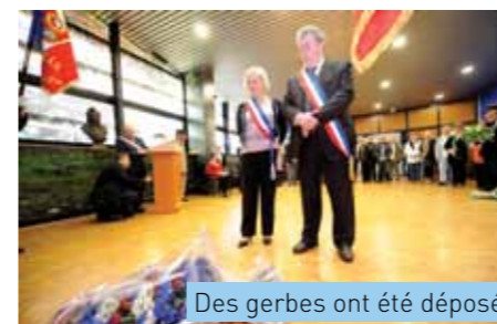
Des gerbes ont été déposées

riques, les Émerainvillois se sont retrouvés au pied du monument aux Morts pour rendre hommage à toutes les victimes de la seconde guerre mondiale. En raison de la météo pluvieuse, la cérémonie commémorative s'est déroulée dans la salle du Conseil municipal. A l'issue des discours et des dépôts de gerbes, l'Union Nationale des Combattants a remis à certains de ses membres des médailles pour leurs actions au sein de l'association.