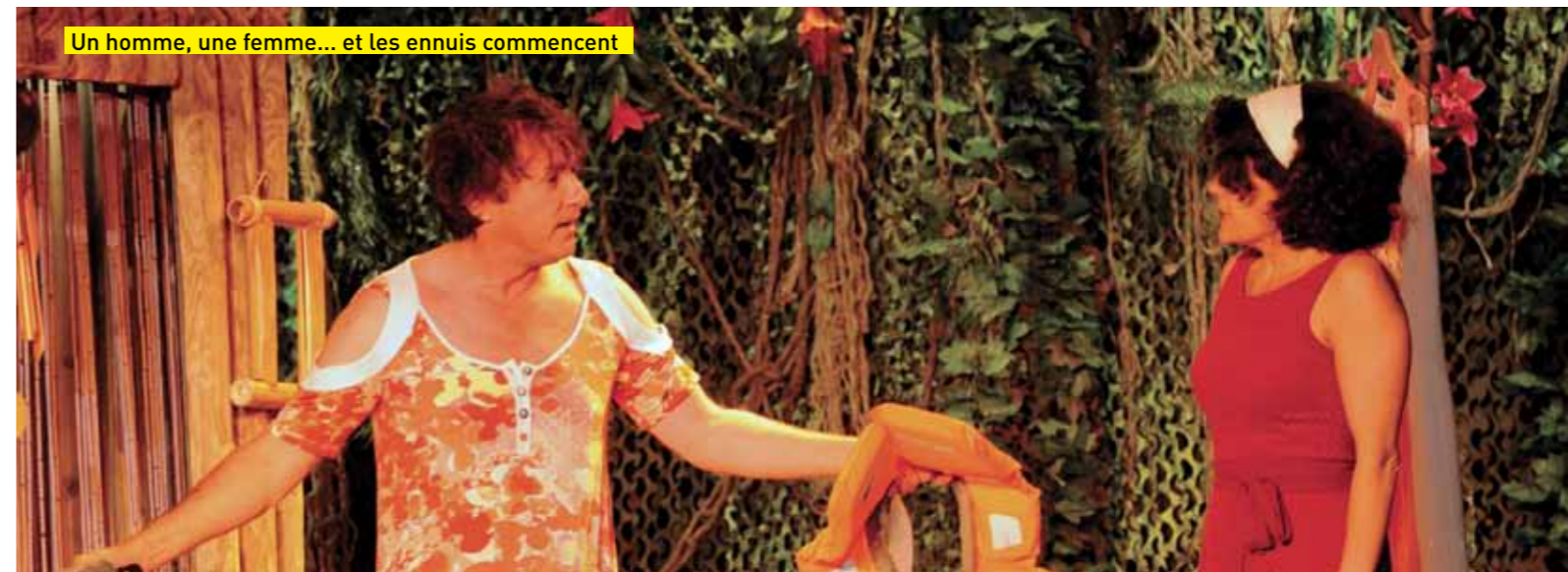
Un homme, une femme... et les ennuis commencent

volontaire... Une rencontre musclée entre deux personnalités bien trempées qui vont devoir cohabiter dans ce jardin d'Eden plutôt infernal ! D'étranges et mystérieux secrets les unissent et les déchirent : l'amour, l'argent, la vengeance, le pouvoir... les fruits de mer. Tout les oppose mais tout les rapproche !