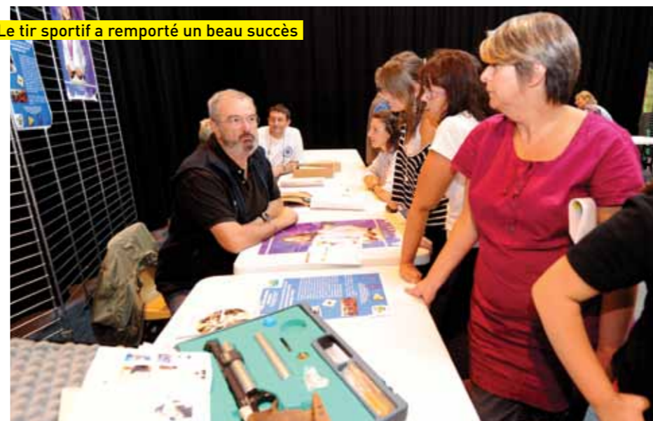
Le tir sportif a remporté un beau succès

diverses associations de la commune. Sport ou culture? Chacun a pu faire son choix et repartir après son inscription. Foot, tir, théâtre, école du cirque, tennis, musique, cuisine, zumba.. Tout le monde a désormais son emploi du temps pour les mois à venir.