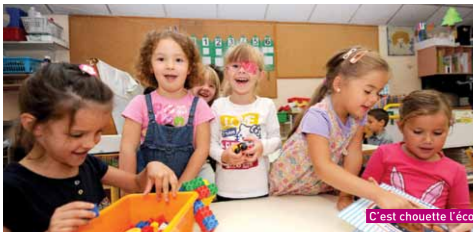
C'est chouette l'école

Du côté de l'école du Bois d'Emery, une autre bonne nouvelle attendait les parents et les écoliers. En effet, au vu du nombre important d'enfants, l'inspection d'Académie a décidé de procéder à l'ouverture d'une classe, et donc l'arrivée d'un nouvel enseignant.