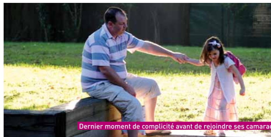
Dernier moment de complicité avant de rejoindre ses camarades