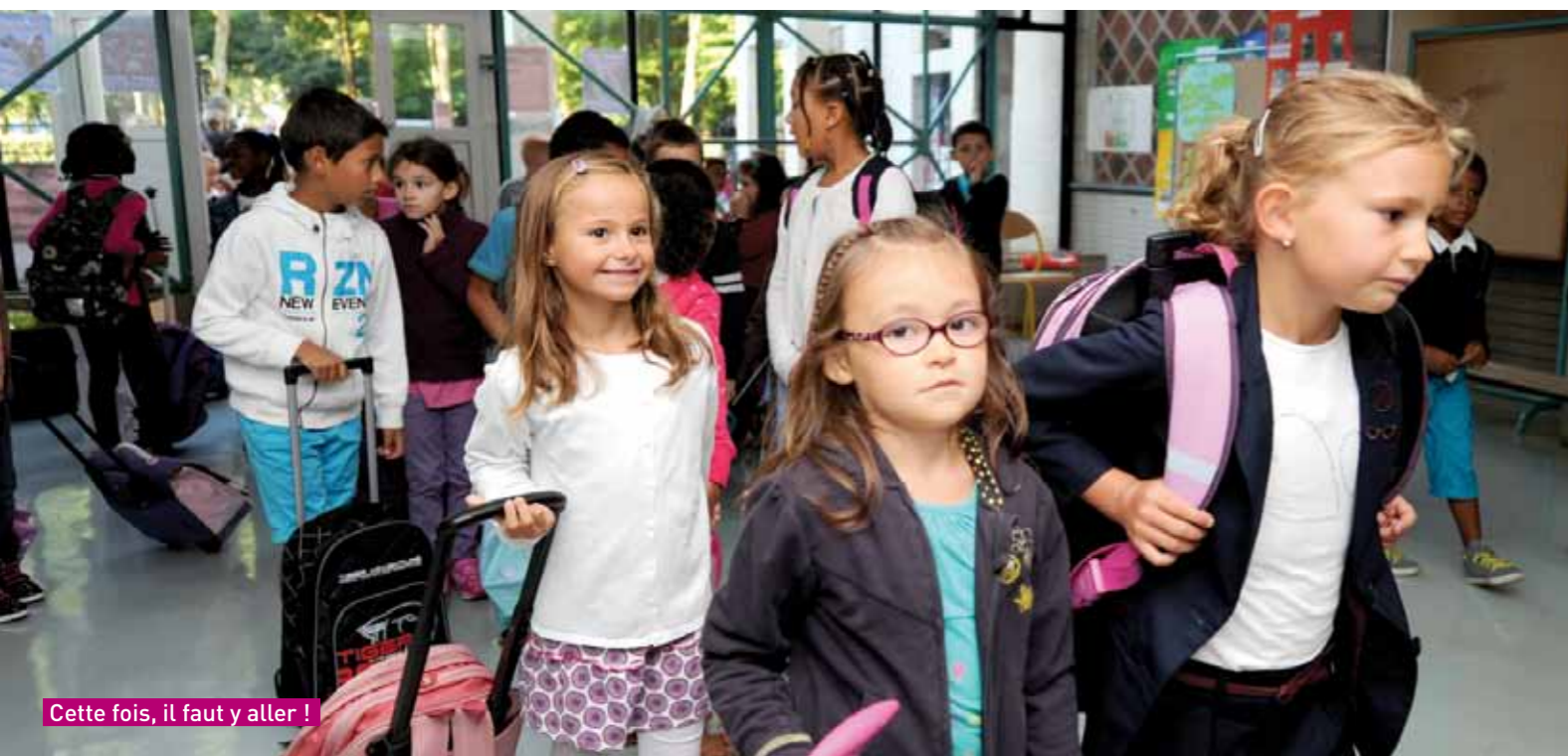
Cette fois, il faut y aller !

Tout a une fin même les vacances. Le 3 septembre, plus de 900 émerainvillois ont repris le chemin de l'école. Entre ceux qui avaient le sourire et ceux qui tentaient de sécher leurs