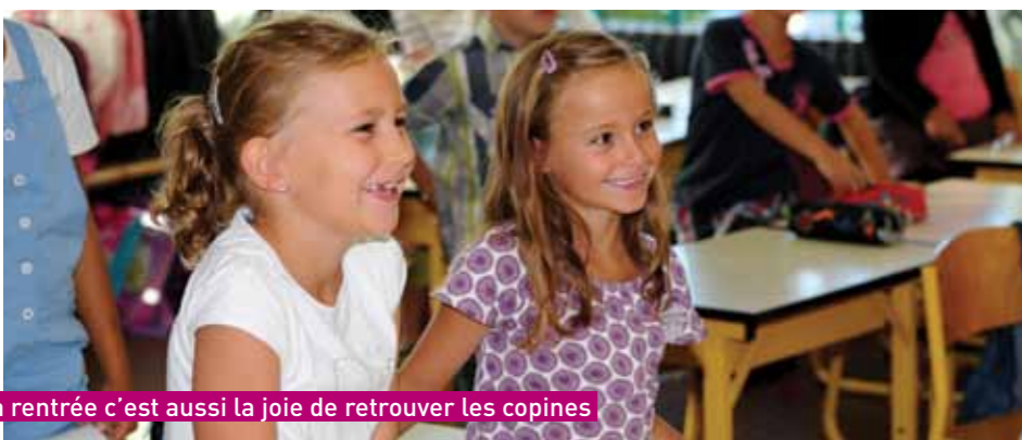
La rentrée c'est aussi la joie de retrouver les copines