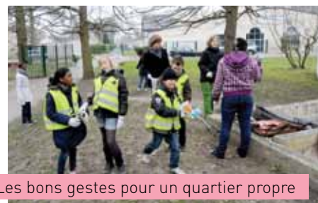
Les bons gestes pour un quartier propre

Une véritable chasse au trésor empoisonné qui s'est soldée par une collecte impressionnante. En fin de journée des œuvres d'art éphémères ont été créées avec ces déchets. Tous ont pu constater que dans notre société de consommation la nourriture était gaspillée, que les emballages de toutes sortes étaient abandonnés sans état d'âme. Même constat pour les canettes et les bou-