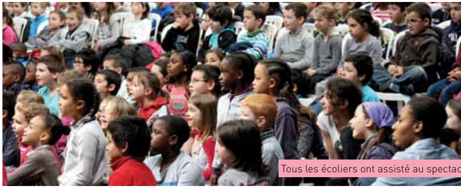
Tous les écoliers ont assisté au spectacle

jeunes aux dangers de la route. Au mois de mars, une semaine de prévention aux risques de la route s'est déroulée dans toutes les écoles de la commune. Les enfants ont pu