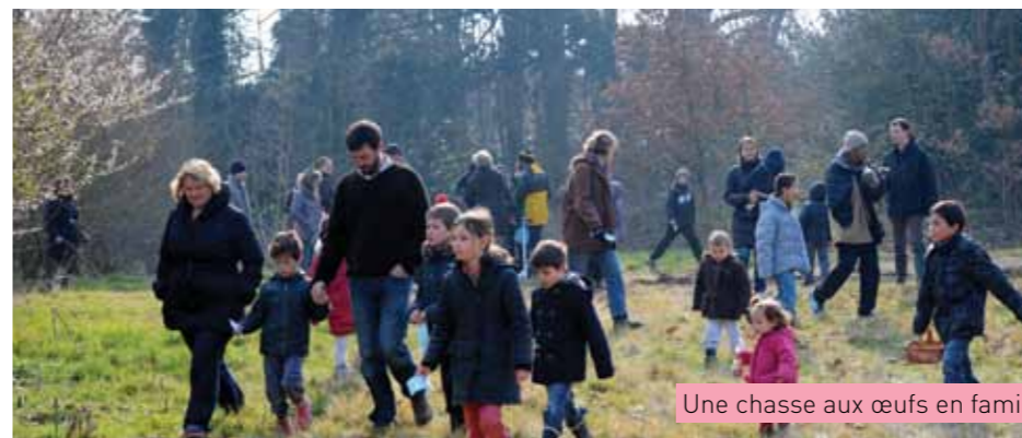
Une chasse aux œufs en famille

mettre la main sur des œufs délicieux. Des parcours avaient été préparés pour les petits tandis que les plus âgés devaient se livrer à une recherche d'indices pour obtenir les friandises. Une véritable course au trésor qui a passionné les familles et qui a laissé de bons souvenirs à tous.