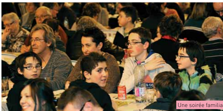
Une soirée familiale

tains avec des lots particulièrement intéressants.