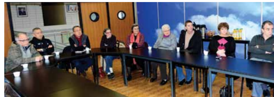
Maison de l'Environnement

oublié de mettre son disque derrière le pare-brise ? Personne ! Ce dispositif permettra d'avoir d'esprit libre. N'oublions pas que la mesure qui entrera en vigueur, en principe mi-avril, est destinée à prévenir l'invasivité des parkings et des rues de notre commune par les automobilistes venant des villes avoisinantes. Pontault-Combault a mis le stationnement payant aux alentours de la gare. De son côté la RATP procédera à des travaux sur la ligne A du RER obligeant les usagers à se rabattre sur la ligne E, donc sur la gare d'Emerainville. Les rues d'Emerainville risquent, par conséquent, d'être congestionnées par cet afflux de voitures. Il fallait impérativement prendre une décision avant que les quartiers ne se retrouvent envahis.